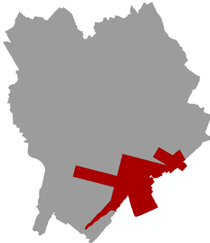
Figura 2 - Ambito oggetto della variante urbanistica agli atti di PGT

La sovrapposizione delle specifiche aree di tutela determina l'individuazione degli ambiti sottoposti a limitazione secondo quanto previsto da regolamento ENAC. La sovrapposizione dei due ambiti territoriali e la loro individuazione